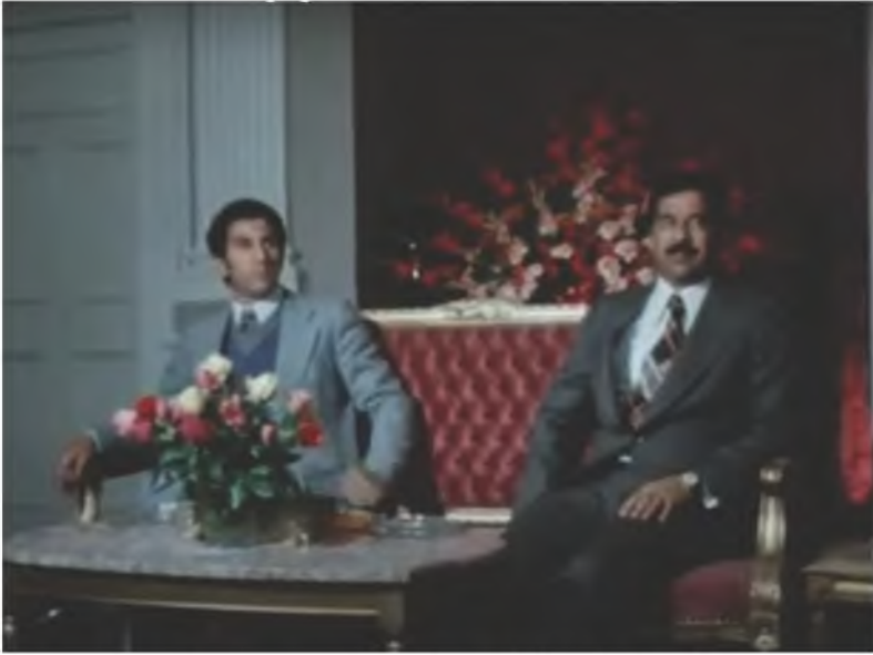
وصول عبد السلام جلود إلى بغداد ولقاؤه صدام حسين، العراق، 3 / 1 / 1976.